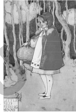
Little Red Riding Hood, illustrated in a 1927 story anthology