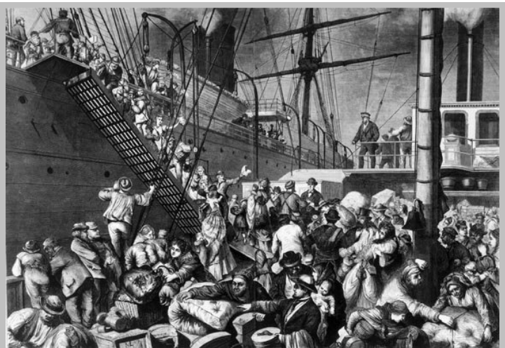
Deutsche Emigranten betreten ein Dampfschiff in Hamburg mit Ziel New York

Die Seereise war lange Zeit das größte und gefährlichste Abenteuer der langen Reise, denn immer wieder sanken Schiffe auf der Überfahrt. In der ersten Hälfte des 19. Jahrhundert reisten die meisten Auswanderer auf dem Zwischendeck, einer eingebauten Ebene zwischen Laderaum und Oberdeck, der Segelschiffe. Die Segelschiffe brauchten etwa sechs bis acht Wochen für die Überfahrt. Die Bedingungen für die Passagiere auf dem Zwischendeck waren primitiv. Erwachsenen stand 1,18 m 2 zur Verfügung, Kindern noch weniger und Kleinkindern stand gar kein eigener Platz zur Verfügung. Tische und Stühle oder extra Platz für das Gepäck gab es nicht. Matratzen und Bettzeug sowie Essgeschirr musste selbst mitgebracht werden. Geschlafen wurde in engen Stockbetten. Gewaschen wurde sich mit Seewasser. Auch Toiletten gab es nur wenige auf dem Oberdeck. Durch die schlechten hygienischen Bedingungen und die teils sehr schlechte Ernährung waren Krankheiten und auch Todesfälle auf den Überfahrten nicht selten.