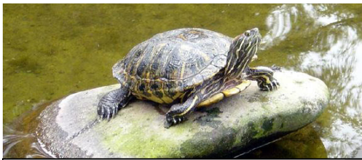
Eine Schildkröte auf einem Stein sitzend

Daher feiern wir an jedem 23. Mai den Weltschildkrötentag.