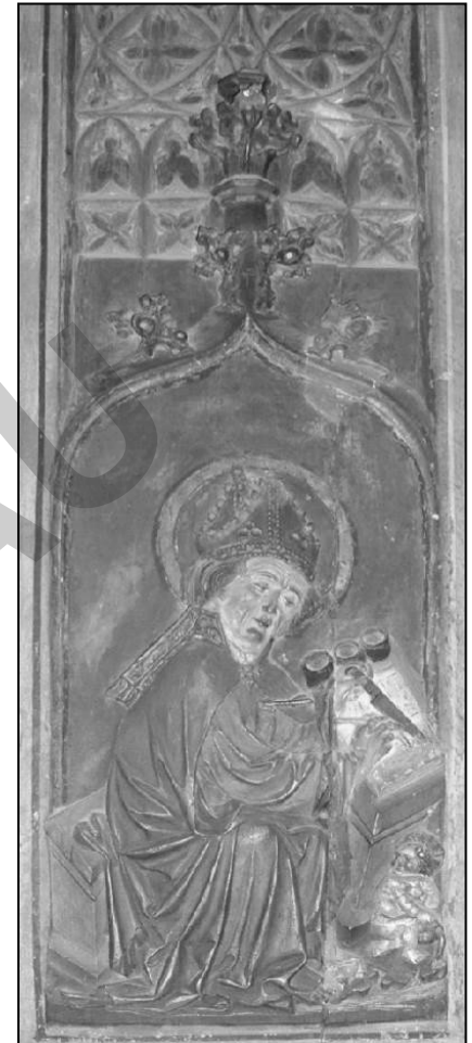
Der hl. Augustinus schreibt mit Feder (und korrigiert mit Messer auf Pergament) / Detail der Kanzel im Naumburger Dom