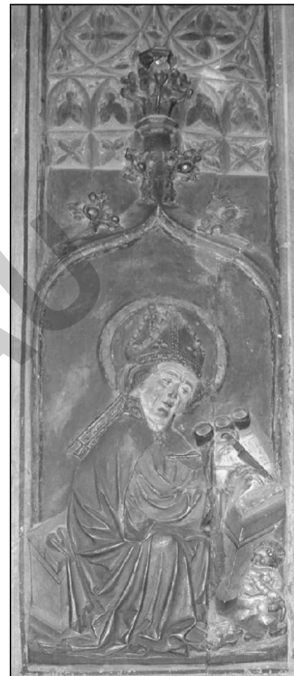
Der hl. Augustinus schreibt mit Feder (und korrigiert mit Messer auf Pergament) / Detail der Kanzel im Naumburger Dom