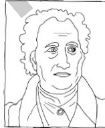
Johann Wolfgang Goethe (später: von Goethe; 1749-1832)

24 25 26 Berühmt ist auch Jakob Maria Reinhold Lenz für sein Drama 27 „Der Hofmeister“, in dem er das Leben des Theologen und 28 Hauslehrers Läufer und seine unglückliche Liebe zur Tochter 29 des Hauses, in dem er arbeitet, schildert. Als deren Verhältnis 30 bekannt wird, fliehen beide, die Tochter mit ihrem un- 31 ehelichen Kind wird am Ende vom Vater verziehen, der 32 Hauslehrer aber kastriert sich selbst und findet eine neue 33 Liebe, mit der er sich zur Ruhe setzt. J.M.R. Lenz hatte selbst 34 ein bewegtes Leben – verheiratet mit einer ehemaligen 35 Freundin Goethes, war Goethe auf die Arbeiten seines 36 ehemaligen Freundes zeitweilig sogar neidisch und fühlte 37 sich von ihm imitiert, nach einem Streit ließ Goethe den 38 verarmten Hauslehrer einer Legende nach sogar später 39 alleine im Regen vor seiner Haustür stehen, als dieser ein- 40 mal Hilfe von Goethe erbeten hatte. Lenz wird später im 41 Alter von nur 41 Jahren alleine tot in Moskau aufgefunden – 42 bis heute ist unklar, wie er starb.