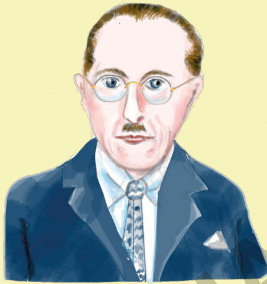
Piet Mondrian (1872–1944)

Piet Mondrian wurde 1872 als Sohn eines Malers in den Niederlanden geboren. Bald schon empfand Piet auch Freude am Malen und ließ sich zum Zeichenlehrer ausbilden.