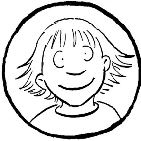
Julia, ihre Schwester, 6 Jahre alt