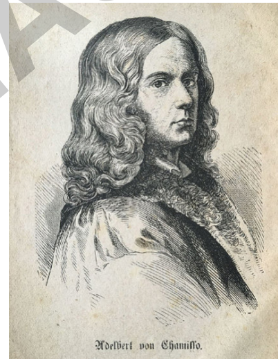
Adelbert von Chamisso, 1831 (aus Reinick, Robert: Gedichte von A. v. Chamisso )

1801–1805 Chamisso wird zum Leutnant befördert; seine Eltern kehren nach Frankreich zurück; er überträgt ein französisches Trauerspiel ins Deutsche; er hat Kontakt mit Romantikern und besucht die Berliner Vorlesung August Wilhelm Schlegels über romantische Poesie; er verfasst ein „Faust“-Fragment.