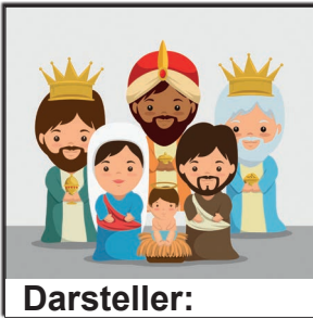
Darsteller: (+/-) 6