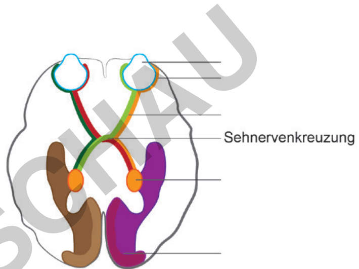
Grafik: Sylvana Timmer

Die Aufgabe von Sinnesorganen ist es, spezifische Reize aufzunehmen und in Signale umzuwandeln, die dann wiederum von einem speziellen Gehirnareal verarbeitet werden. Beim Sehsinn ist dies der visuelle Cortex (Sehrinde), der im hinteren Teil des Gehirns verortet ist. Der spezifische Reiz, der hier verarbeitet wird, ist der Lichtreiz in Form von