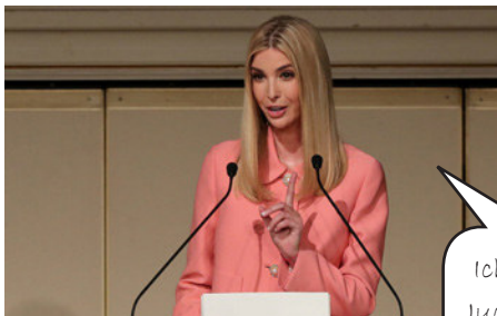
Ivanka Trump (Unternehmerin)

Ich bin für meinen Mann zum Judentum konvertiert.