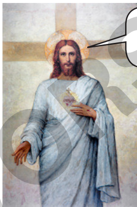
Jesus (Stifter des Christentums)