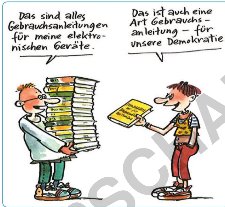
Erich Rauschenbach, Baaske Cartoons, Müllheim

Beschreibt den Cartoon und verdeutlicht die Aussage, die der Künstler damit trifft.