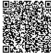
Hilfe Aufgabe 3