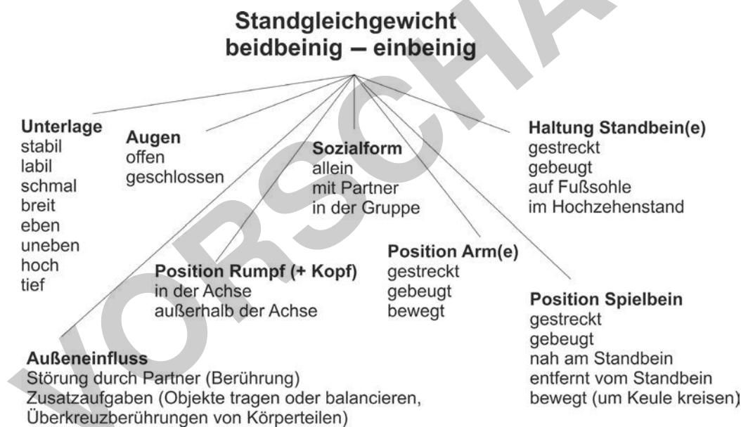
Abb. 4: Systematik Variation Standgleichgewicht

In Anlehnung an die Systematik zum Gleichgewicht (s. Theorie Kap. 4) lässt sich eine solche auch für den Einbeinstand erstellen. Sie bietet Differenzierungsmöglichkeiten und viele Anregungen, um angemessene Herausforderungen zu formulieren. (Abb. 4)