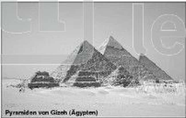
Pyramiden von Gizeh (Ägypten)