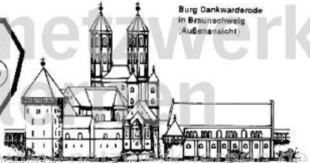
Burg Dankwarderode in Braunschweig (Außenansicht)