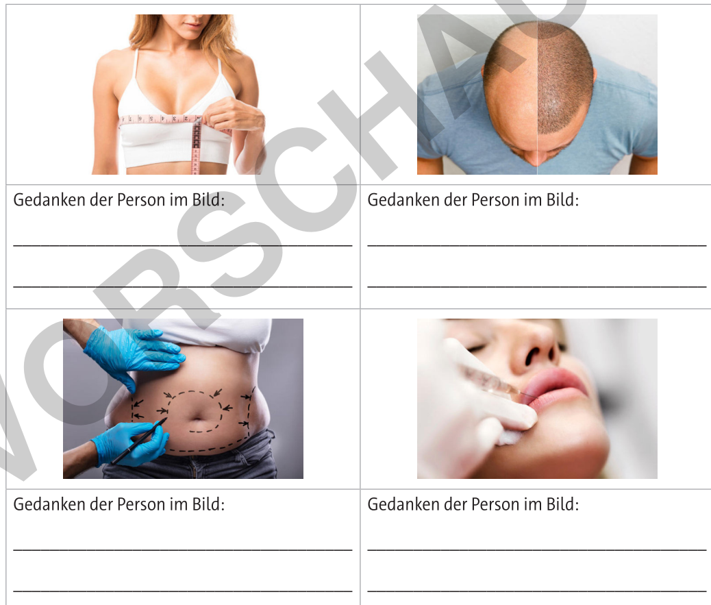
Bild 1 © Antonio Diaz/iStock/Getty Images Plus. Bild 2 © Aleksandr Rybalko/iStock/Getty Images Plus. Bild 3 © Andrey-Popov/iStock/Getty Images Plus. Bild 4 © Nastasic/E+.

Welchen Eingriffen würden Sie zustimmen? Welche Eingriffe lehnen Sie ab?