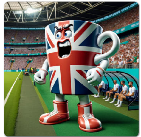
erstellt mit DALL-E von OpenAI

„Das schaffen unsere Jungs locker!“, sagst du siegessicher zu deinen Freunden. „Wir fegen die Engländer und ihr bescheuertes Maskottchen aus dem Stadion!“ Doch da dreht sich das Maskottchen der englischen Mannschaft, Teacup Tommy, plötzlich um und rennt direkt auf dich zu. „EXCUSE ME, WHAT DID YOU SAY?“, fragt dich das Maskottchen mit wütender Stimme. „Ähm, nichts ääh ... nothing“, murmelst du. Dann wird dir schwarz vor Augen. Als du wieder aufwachst, bist du in einem dunklen Raum. Am Ende des Raums ist eine Tür, doch diese ist verschlossen. Auf dem Boden liegt ein Zettel.