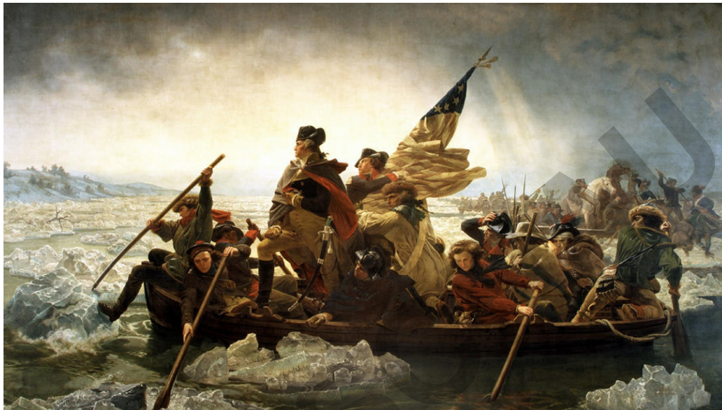
Emanuel Leutze (1851): „Washington überquert den Delaware“, Wikimedia, gemeinfrei