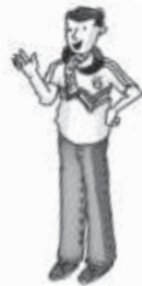
Can, 17 Jahre

Reporter Robert Bender ist im Fußballstadion und spricht mit den Fußballfans. Die große Frage ist: „Warum lieben Sie Fußball?“