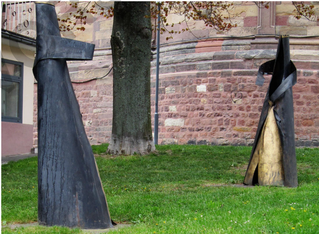
Streit der Königinnen von Jens Nettlich