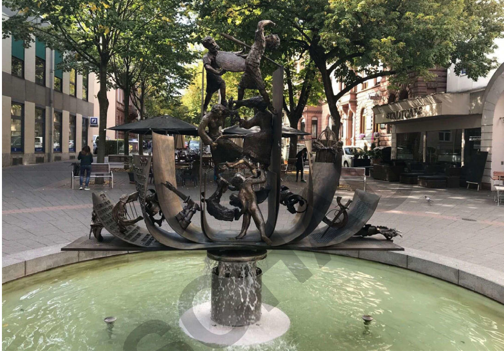
Nibelungenliedbrunnen von Gustav Nonnenmacher

Worms gilt als Nibelungenstadt, da dort viele Handlungen des ersten Teils des Nibelungenliedes spielen. Außerdem ist die Stadt die Heimat von Kriemhild und ihren drei Brüdern. In Worms befinden sich auch zwei Skulpturen, die das Nibelungenlied künstlerisch umsetzen.