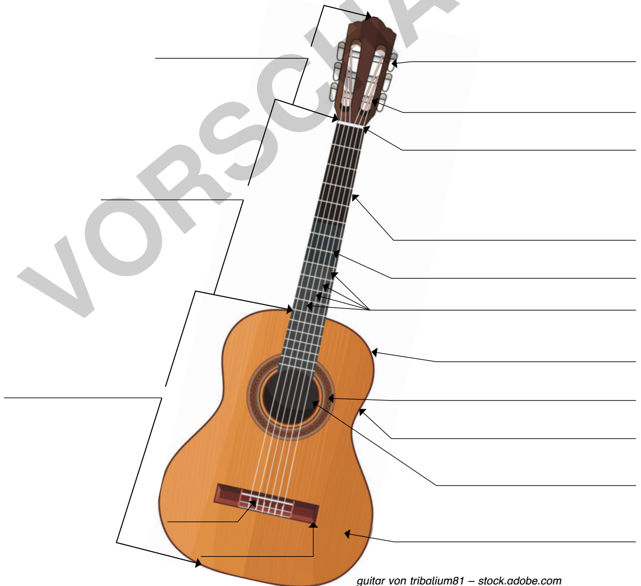
guitar von tribalium81 – stock.adobe.com

Lies den Text, recherchiere im Internet und trage die richtigen Begriffe ein.