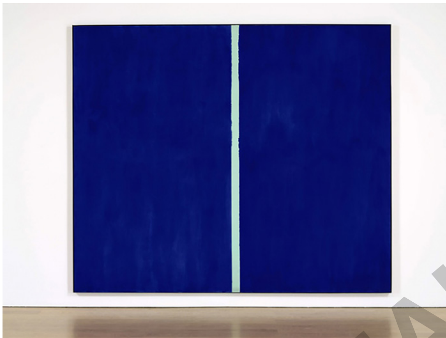
© Barnett Newman's 'Onement VI', Sotheby's, New York.