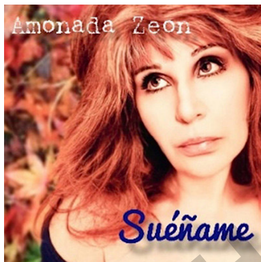
© Amónada Zeon. One with All Music