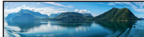
Landschaft in Norwegen mit Fjorden

In Europa gibt es erstaunlich viele Landschaften und Lebensräume. Im Norden und Osten des Festlands erstreckt sich eine riesige _____. Sie reicht von den Niederlanden bis in die Ukraine und ist durchzogen von Marschlandschaften, _____ und Seen.