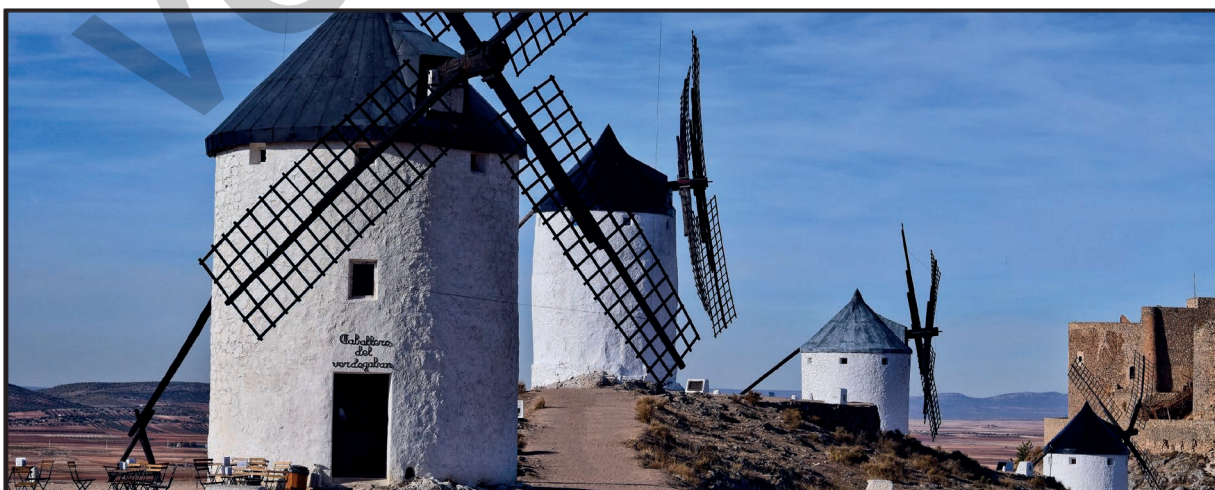
Landschaft in Südeuropa mit Windmühlen

Im Februar 2022 begann ein Krieg in der Ukraine. Mit Russlands Angriff auf die Ukraine ist ganz Europa betroffen. Hohe Benzinpreise und _____, sowie Engpässe in der Nahrungsmittelversorgung sind die Auswirkungen des Krieges. Europa sucht nach dringenden Alternativen zu den russischen Rohstoffen. Steigende Flüchtlingszahlen, erhöhte Preise und ein gedämpftes Wirtschaftswachstum zeichnen sich ab.