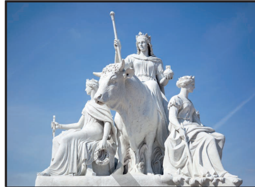
Die schöne Europa mit Gottvater Zeus in Gestalt eines Tieres

Europa ist nach Australien der zweitkleinste Kontinent aber äußerst vielfältig. Seinen Namen verdankt er einer Königstochter aus der griechischen Sage: die schöne Europa, Tochter von König Agenor, wurde von dem obersten Gott _____ in Gestalt eines weißen Stiers ins Mittelmeer entführt. Zeus schwamm mit ihr bis nach Kreta und machte sie zur Königin der Insel. Seit der Antike heißt der ganze Kontinent Europa.