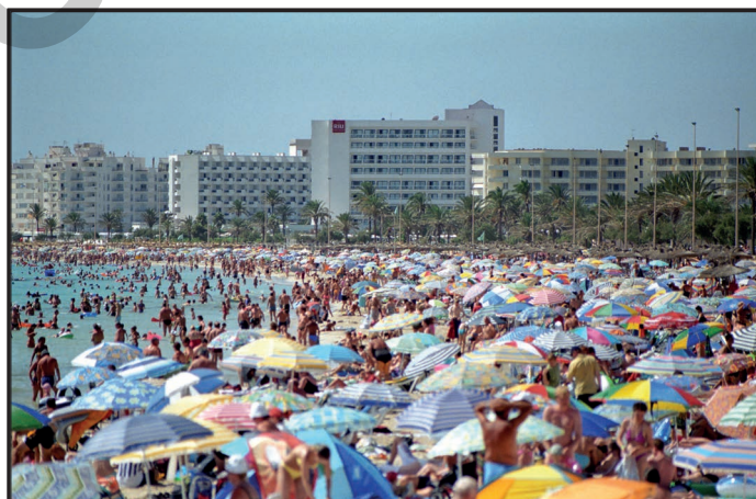
Massentourismus am Strand

Trotz Unsicherheiten bezüglich Corona, Ukrainekrieg, gestiegenen Preisen und Klimabedenken wollen die meisten nicht verzichten und wieder verreisen. 49 Prozent wollen mindestens einen Urlaub in _____ machen. Die beliebtesten europäischen Reiseziele waren 2022 Spanien, Italien, Griechenland, _____, die Kanarischen Inseln und Deutschland.