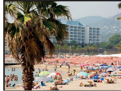
Massentourismus in den Mittelmeerländern

Beim Pistenbau wird eine neue Landfläche benötigt. Bäume müssen mitsamt ihren _____ abgeholzt werden, Flüsse werden umgeleitet, Wiesen zugepflastert und _____ gesprengt. Die ursprüngliche Landschaft wird zerstört. Oft spülen starke Regengüsse Teile des Bodens ab, bevor das nachwachsende _____ den Boden schützen kann. Der monatelange Skibetrieb schädigt Gräser, _____ und Büsche und die Gefahr der Bodenabschwemmung wächst in allen Skigebieten.