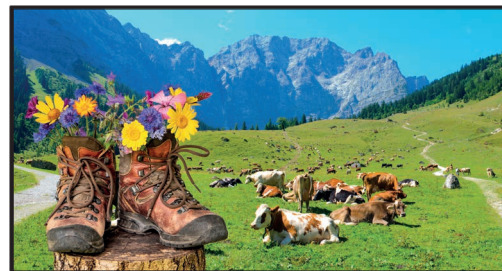
Die bayerischen Alpen

Gebirge, Hügelländer, Ebenen, Flusstäler, Hochflächen und Küstenebenen wechseln häufig innerhalb kurzer Entfernungen. Die Alpen, das bedeutendste europäische Hochgebirge, trennt den Mittelmeerraum von Nord- und _____.