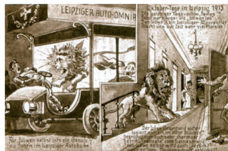
https://commons.wikimedia.org/wiki/File:Leipziger_Loewenjagd_Karikatur.jpg , 1913, gemeinfrei [07.04.2021]