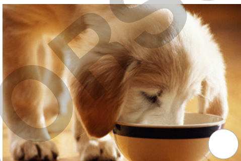
Foto: Ghislain &amp; Marie David de Lossy/The Image Bank/Getty Images