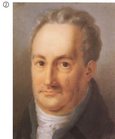
Caroline Louise Seidler: J. W. Goethe, 1811