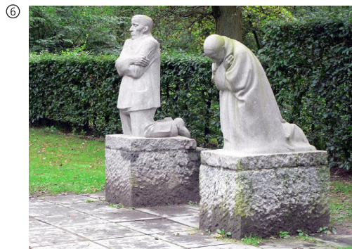
Käthe Kollwitz: Trauerndes Elternpaar, 1914–1932