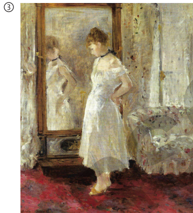
Berthe Morisot: Der Spiegel (La Psyché), 1876