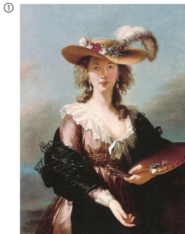
Élisabet-Louise Vigée-Lebrun: Selbstbildnis mit Strohhut, 1782