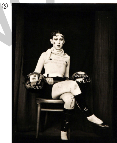
Claude Cahun: I am training, don't kiss me, 1927