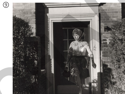
Cindy Sherman: Untitled Film Still #20, 1978

© Courtesy of the Artist and Metro Pictures