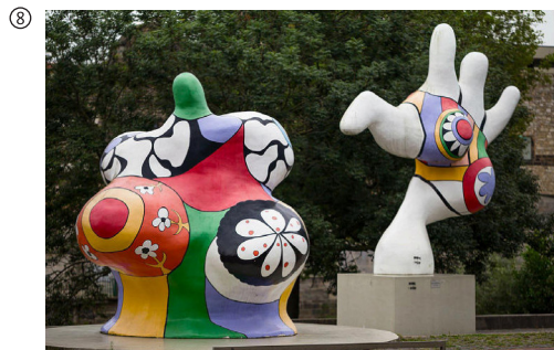
Niki de Saint Phalle: Nanas, aufgestellt 1974