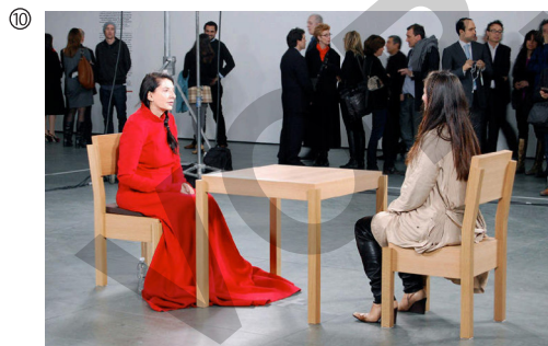
Marina Abramović: The Artist is Present, 2010