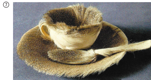
Meret Oppenheim: Le Déjeuner en Fourrure (Frühstück im Pelz), 1936