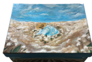
© Atillâ Aktaş, example box 12