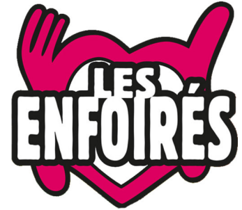
Abb.: Les Restos du cœur / marque déposée

Depuis que Zaz est devenue riche grâce aux millions de ventes de ses albums et singles, elle s'est engagée dans des associations caritatives, notamment dans le célèbre groupe Les Enfoirés . Rien n'est aussi simple qu'il n'y paraît. Sur Internet, on trouve des articles sur ce groupe auquel appartiennent de nombreux artistes. Ce qui semble honorable ne va pas sans une certaine autopromotion. Les artistes, dont Zaz depuis 2014, se produisent lors de concerts particuliers dont les bénéfices sont reversés à une association caritative appelée Les Restos du Cœur . Ces restaurants distribuent de la nourriture à des personnes dans le besoin et les aident à se réinsérer.