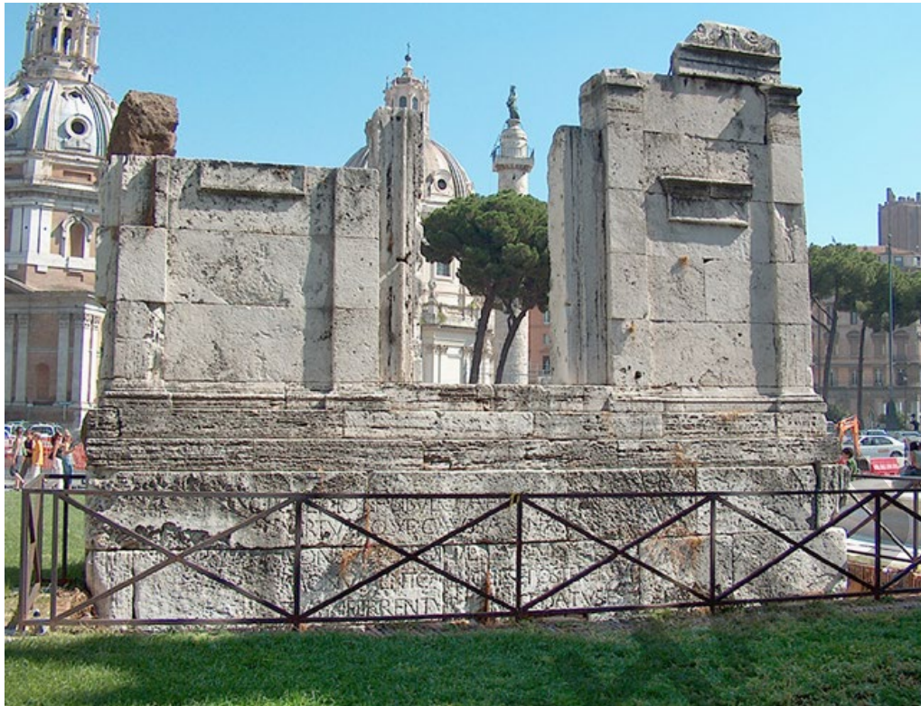
Abb. 2: Piazza Venezia, Grabmonument der Späten Republik (CIL VI 1319)

Da die Inschrift schon etwas in die Jahre gekommen ist, hilft uns eine kleine Informationstafel mit einer Umschrift, einer Transkription.