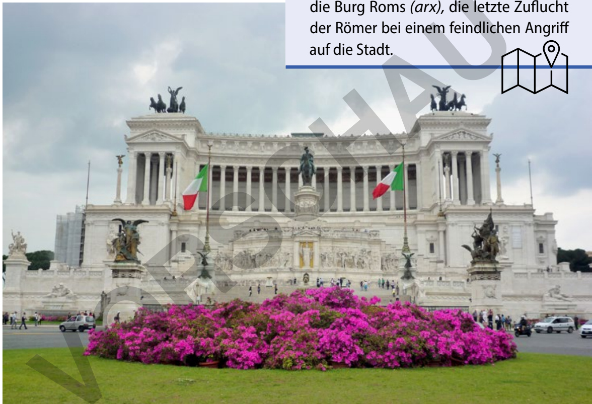
Abb. 1: Piazza Venezia, Denkmal Viktor Emanuel II.

Wir sind endlich in Rom angekommen und starten unsere Erkundungen auf der Piazza Venezia. Vor unseren Augen erhebt sich das imposante Denkmal für Vittorio Emanuele II., den ersten König Italiens (1861–1878). Welchen Spitznamen hat das Gebäude aufgrund seiner Form erhalten?