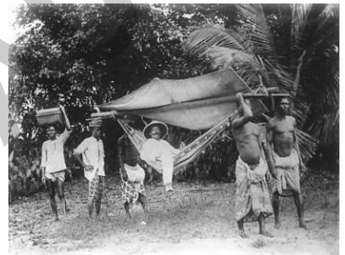
Ein deutscher Kolonialherr lässt sich von Einheimischen tragen.

Um die Jahrhundertwende hatte das Deutsche Reich Angst, in diesem Wettrennen um neue Herrschaftsgebiete leer auszugehen. Der damals regierende deutsche Kaiser Wilhelm II. und viele deutsche Politiker verlangten für die Deutschen ebenfalls einen „Platz an der Sonne“. Das Deutsche Reich gründete daher mehrere kleine Kolonien in Afrika und in Asien.