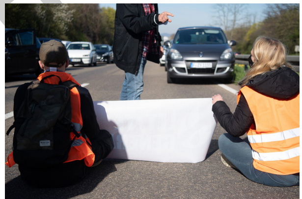
Klimaaktivisten der „Letzten Generation“