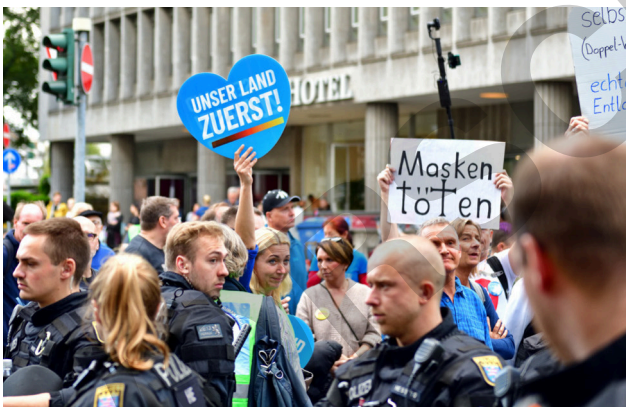
Demonstration von AfD-Anhängerinnen und -Anhängern