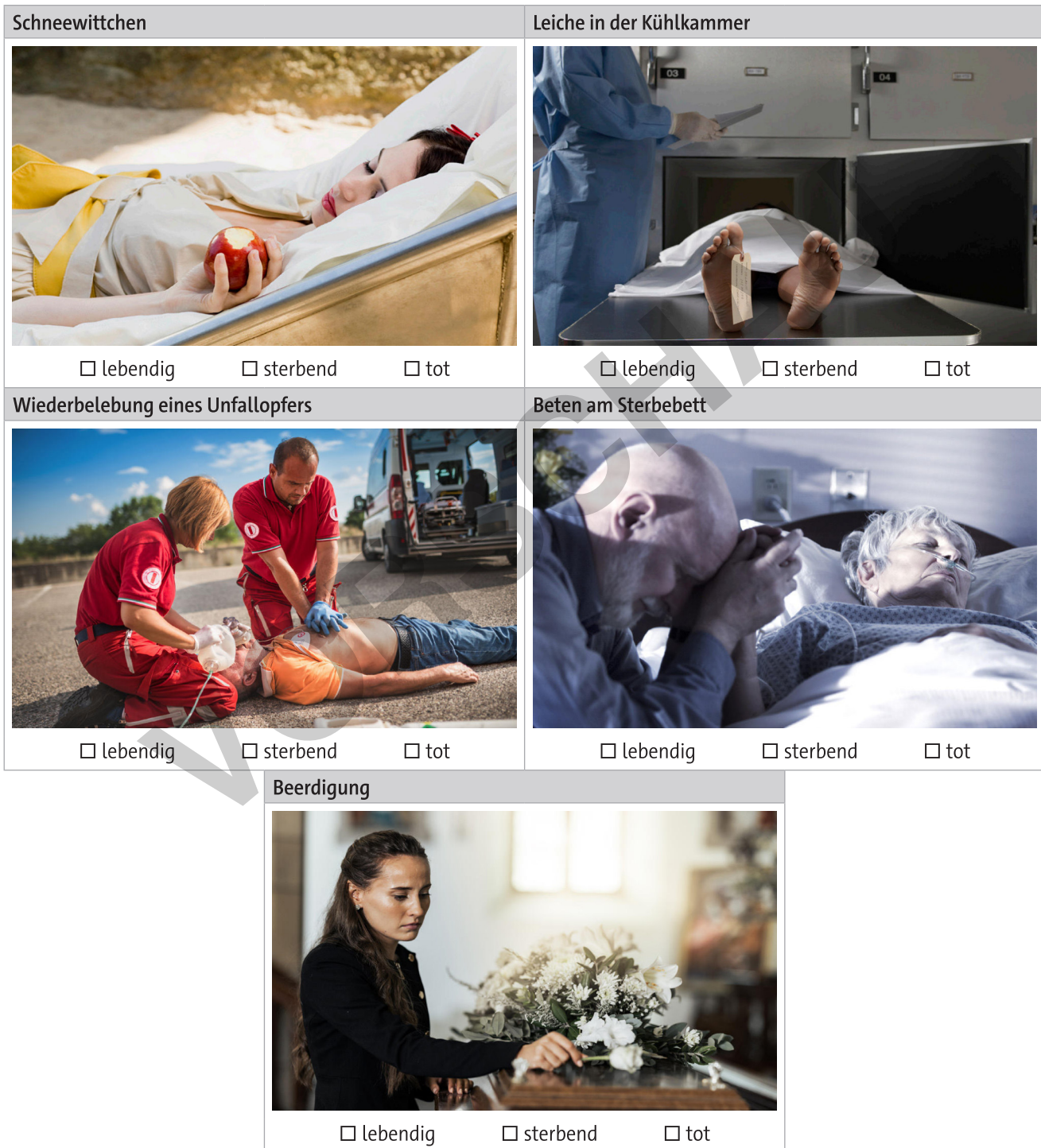
Bild Schneewittchen: Images Source/Vetta. Bild Kühlkammer: Darrin Klimek/DigitalVision. Bild Wiederbelebung: franckreporter/E+. Bild Betend: Foto-disc/DigitalVision. Bild Beerdigung: People Images/iStock/Getty Images Plus.