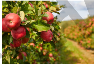
vacaciones en el campo