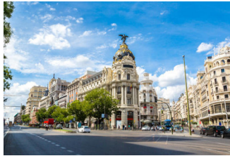
vacaciones en la ciudad