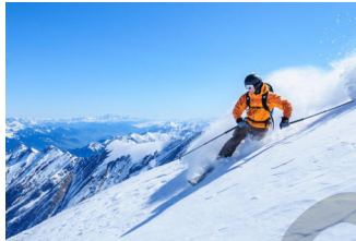
vacaciones de esquí