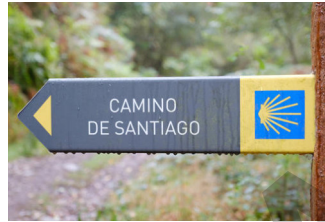
viaje de peregrinación