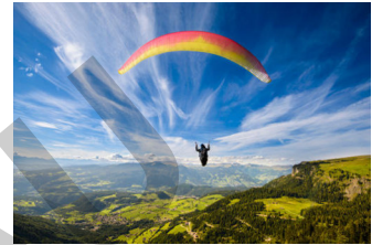
vacaciones de aventura