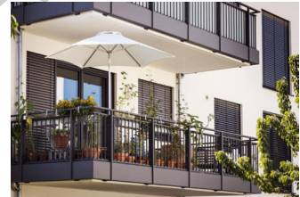
vacaciones en casa