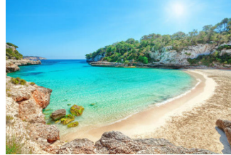
vacaciones en la playa