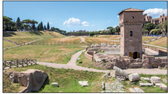
Circus Maximus

Emma, eine junge Lateinschülerin aus Würzburg, ist mit ihrer Klasse auf Studienfahrt in der urbs aeterna . Plötzlich entdeckt sie am Circus Maximus eine alte, verblasste Inschrift. Ihr fallen besonders deren merkwürdige Vertiefungen ins Auge. Ist dies ein Rätsel oder vielleicht eine wichtige Nachricht für die Nachwelt? Was will die Inschrift ihr mitteilen? Emma möchte das Rätsel hinter den Buchstaben um jeden Preis lösen. Doch sie benötigt hierzu deine Hilfe. Schafft ihr es gemeinsam, dem Rätsel auf die Spur zu kommen?