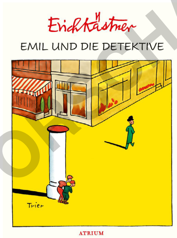
Atrium Verlag/Illustration: Walter Trier (1929)