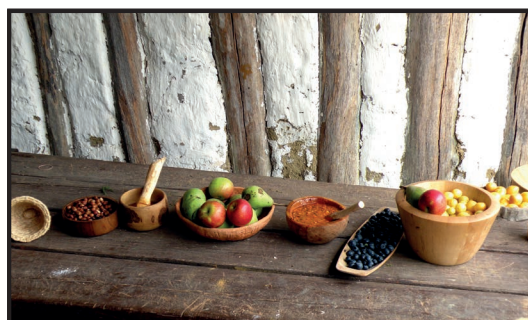
Getreidesorten aus der Jungsteinzeit

Die Bevölkerungszahl wuchs stetig an. Um 8000 v. Chr. lebten auf der Erde bereits 30 Millionen Menschen.