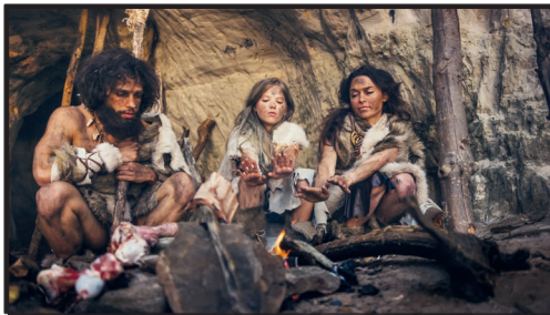
Cro-Magnon-Menschen am Lagerfeuer

Der Cro-Magnon und der Neandertaler lebten einige tausend Jahre nebeneinander. Sie sind sich sicher begegnet. Schließlich wohnten, jagten, wanderten und sammelten sie Jahrtausende lang im selben _____. Vielleicht trafen sie sich auch, um _____, Werkzeuge, Waffen oder Kleidungsstücke auszutauschen.