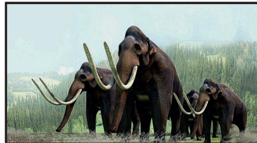
Mammuts bei der Nahrungssuche

In dieser Zeit hat sich das Klima mehrfach verändert. Riesige Gletscher bedeckten die Erde, zottelige Wollhaarmammuts kämpften sich durch Stürme, Menschen in dicken Tierfellen stapften durch den Schnee.