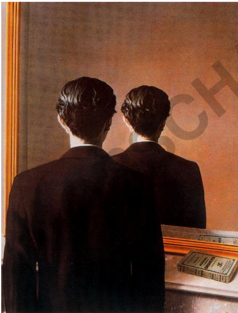
René Magritte: Die verbotene Reproduktion (1937)