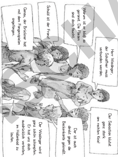
Beteiligten am Unfall