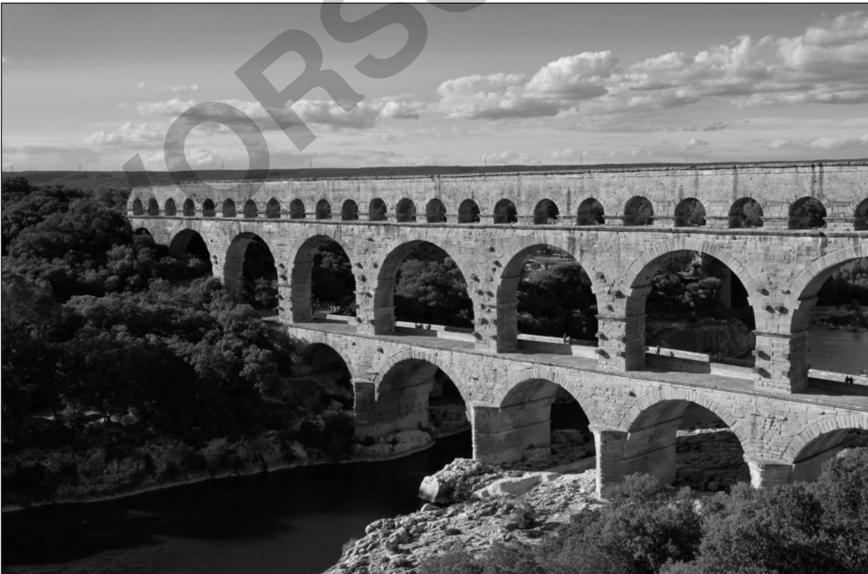
Technische Errungenschaften der Römer: Aquädukte versorgten die römischen Städte mit Wasser. (Abgebildet ist das Aquädukt von Pont du Gard bei Nîmes in Südfrankreich.)