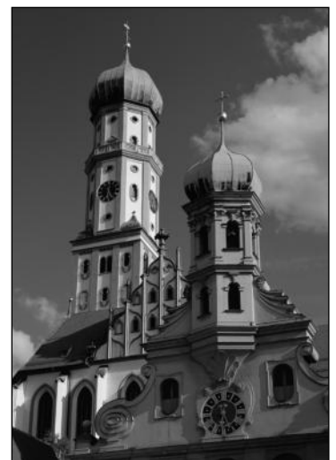
Basilika Sankt Ulrich und Afra

ten das Christentum auch in unsere Heimat.