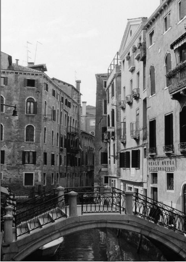
Kanal in Venedig

Venedig: In der Stadt gibt es mehr als 170 Kanäle, mehr als 400 Brücken und zahlreiche Kulturdenkmäler. Autos haben in dieser Stadt keinen Platz.