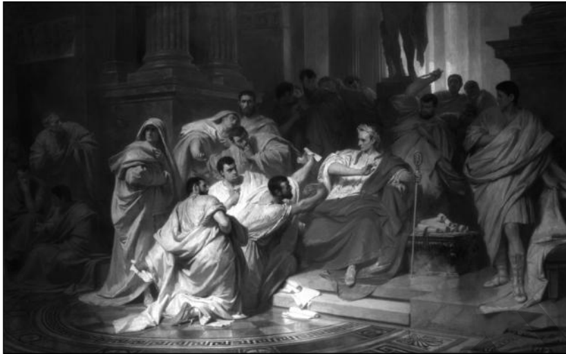
Die Ermordung Caesars: So könnte es sich zugetragen haben.

Caesar stammte aus einem alten römischen _____. Schon frühzeitig suchte Caesar Verbündete und fand sie in der Partei der _____. Deren Anführer, der reiche _____, half ihm mit Geld, seine Pläne zu verwirklichen. Bereits im Alter von _____ Jahren wurde er zum _____ gewählt. Caesar schloss mit den Feldherren _____ und _____ das sogenannte Triumvirat (= Dreimännerbund), ihn zum wirklichen Herrn von Rom machte. Im weiteren Verlauf stieg er durch den siegreichen Krieg in _____ und durch die Macht seiner Legionen zum _____ Mann im römischen Reich auf. Nach dem Tod von Crassus hatte sich Pompeius zwar gegen Caesar gewandt, wurde aber von ihm besiegt. Als Caesar nach Rom zurückkehrte, zeigte er seine großen _____ Fähigkeiten. Mit zahlreichen Reformen brachte er das Volk auf seine Seite. Er wollte jedoch als _____ Herrscher regieren. Zur Sicherung dieser Alleinherrschaft ließ er sich vom Senat zum _____ ernennen. Als sich Caesar im März des Jahres _____ vom Senat den Titel „König“ antragen lassen wollte, kam es zu einer Verschwörung gegen ihn. In einer Senatssitzung wurde er von den _____ mit 23 Dolchstichen ermordet.