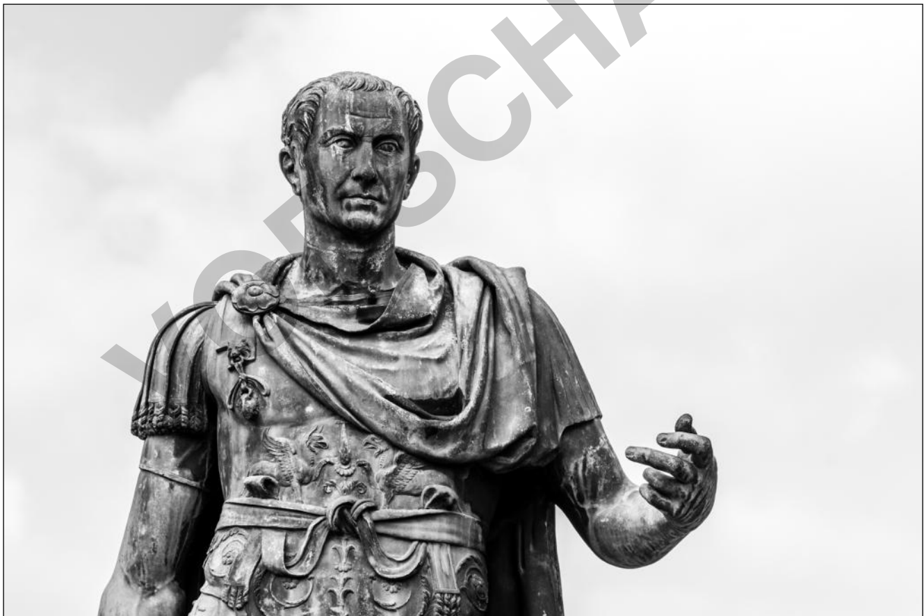
Statue von Julius Caesar