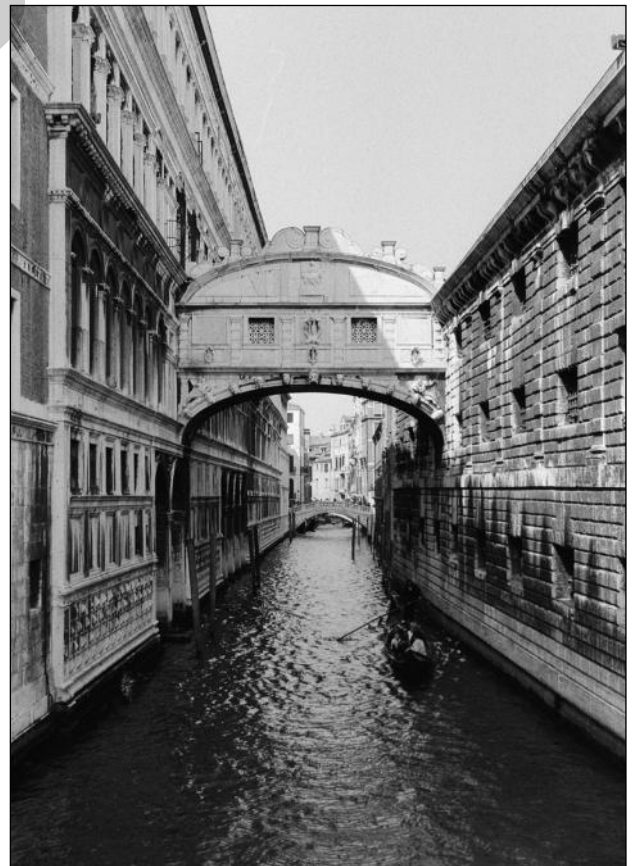
Seufzerbrücke. Verbindet den Dogenpalast mit dem früheren Gefängnis.