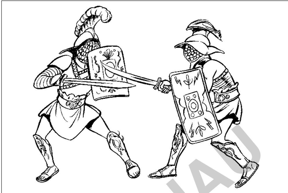
Gladiatoren im Kampf