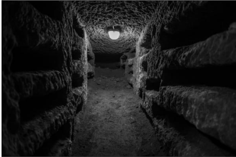
Katakombe: Während der Christenverfolgungen wurden die Katakomben (eigentlich unterirdische Begräbnisstätten der Christen) auch für Versammlungen genutzt. Es entstanden sogar unterirdische Kapellen.

Nach dem ersten Pfingstfest verließen die Apostel Jerusalem, um der ganzen damaligen Welt die Lehre Jesu zu verkünden. Wollten sie aber ihren Missionsauftrag erfüllen, mussten sie nach _____. Eine Religion, die sich dort durchsetzen konnte, würde im ganzen Reich _____ finden.