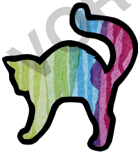
KATZE Seite 13 + 21