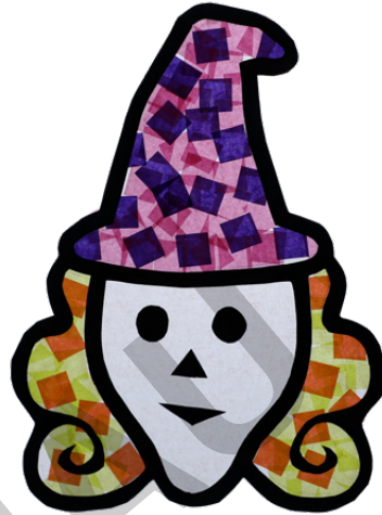
HEXE Seite 12 + 20