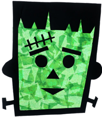
FRANKENSTEIN Seite 11 + 19