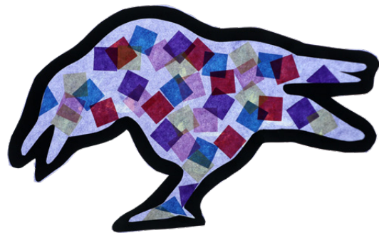
RABE Seite 14 + 22