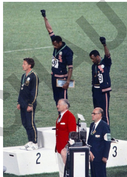
Rechts; Tommie Smith und John Carlos, Olympia 1968