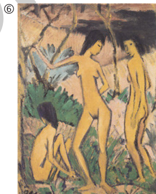
Otto Mueller: Drei Frauen, um 1919; Leimfarbe auf Hessian, 119 x 88,5 cm; Brücke-Museum, Berlin