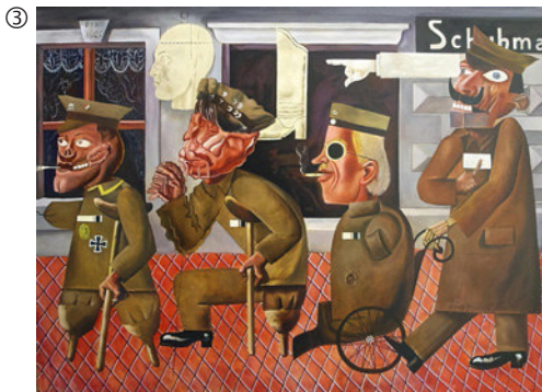
Otto Dix: Die Kriegskrüppel, 1920; Öl auf Leinwand; Stadtmuseum Dresden