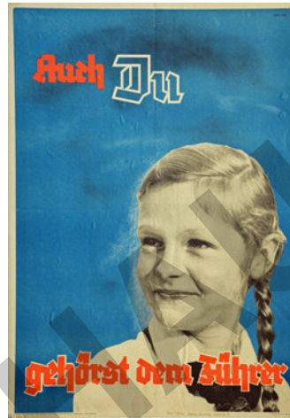
© Adolf Wissel: Kahlenberger Bauernfamilie, 1939 Unbekannter Urheber: Auch du gehörst dem Führer, um 1939

Was verstanden die Nationalsozialisten unter Kunst? Wie beeinflussten Politik und Propaganda das künstlerische Schaffen in der NS-Diktatur? Und wie war die Haltung zur modernen Kunst? Mit diesen Fragen setzen sich die Schülerinnen und Schüler im vorliegenden Beitrag zur Kunst im Nationalsozialismus und zum propagierten Menschenbild auseinander. Sie betrachten und analysieren dazu insbesondere Gemälde und Plakate und widmen sich in eigenen gestaltungspraktischen Auseinandersetzungen dem Thema auch unter aktuellen Aspekten.