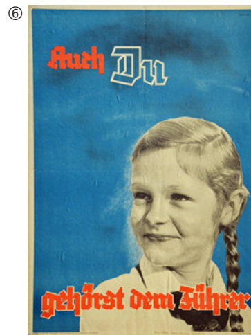
Unbekannter Urheber: Auch Du gehörst dem Führer, um 1939