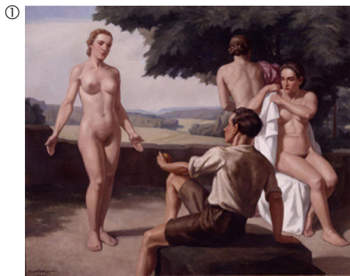
Ivo Salinger: Das Urteil des Paris, 1939