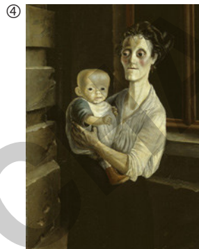
Otto Dix: Frau mit Kind, 1921; Öl auf Leinwand, 120 x 81 cm; Galerie Neue Meister, Dresden