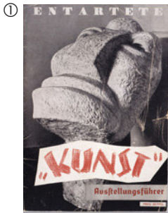
Titelseite des Ausstellungsführers mit Werk von Otto Freundlich: Der Neue Mensch, 1912