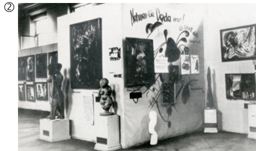
Blick in die Ausstellungsräume; Zentrum Paul Klee