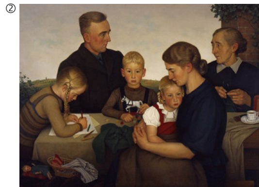
Adolf Wissel: Kahlenberger Bauernfamilie, 1939