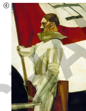
Hubert Lanzinger: Der Bannerträger, um 1934