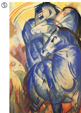
Franz Marc: Der Turm der blauen Pferde, 1913; Öl auf Leinwand, 200 x 130 cm; Original verschollen