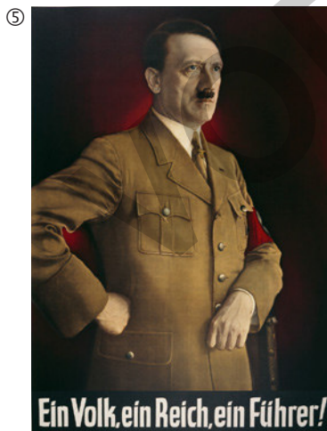
Heinrich Knirr: Ein Volk, ein Reich, ein Führer!, 1938/39