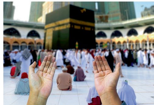
Die Kaaba in Mekka