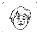
un niño llorando