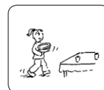
alguien poniendo la mesa