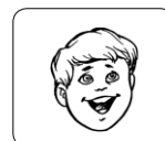
un niño riendo