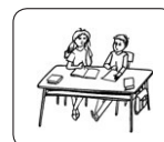
dos personas hablando