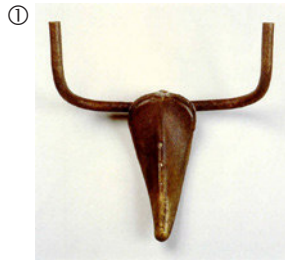
Pablo Picasso: Stierkopf, 1942