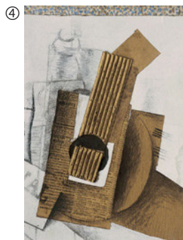
Georges Braque: Mandoline, 1914