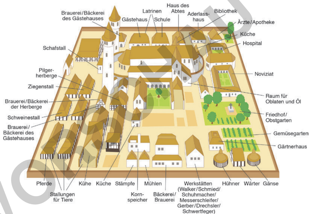
Zeichnung: Monika Köhl