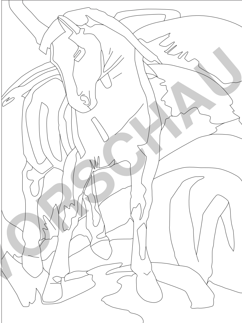
Franz Marc "Blaues Pferd I"