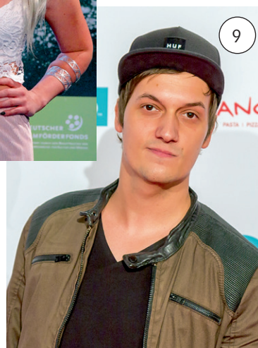
Photos 1–9: © Von Toglenn– Eigenes Werk, CC BY-SA 4.0, © By Ilona Higgins, CC BY-SA 2.0, © By Anthony Quintano, CC BY 2.0, © Von Steindy (talk) – Eigenes Werk, CC BY-SA 3.0, © By CharliePhotographic, CC BY 2.0, © Von Raimond Spekking, CC BY-SA 4.0, © Von 9EkieraM1 – Eigenes Werk, CC BY-SA 3.0, © Von Toglenn – Eigenes Werk, CC BY-SA 4.0, © Von Raimond Spekking, CC BY-SA 4.0