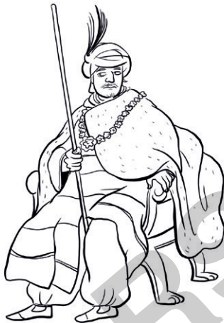
König von Babylon