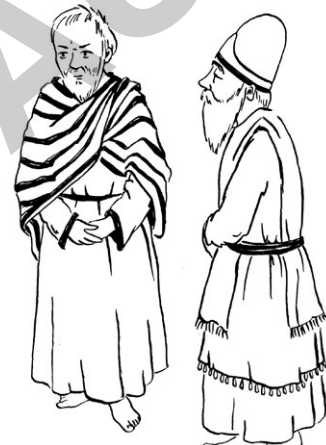
Ratgeber des Königs