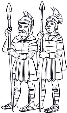
Soldaten des Königs von Babylon